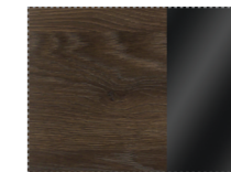
табак+ черный глянец