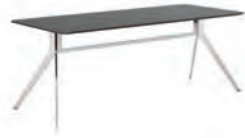
СТОЛ ПРЯМОЙ (SJT 101) Ш: 180 / Г: 90 / В: 74 (SJT 102) Ш: 200 / Г: 90 / В: 74