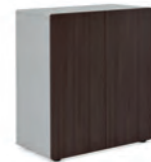
ШКАФ НИЗКИЙ (SJT 401) Ш: 82 / Г: 42,2 / В: 90