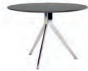
СТОЛ ПЕРЕГОВОРОВ (SJT 702) Ø: 110 / В: 74