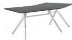
СТОЛ ИЗОГНУТЫЙ (SJT 121) Ш: 228 / Г: 130 / В: 74