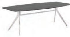
СТОЛ ПЕРЕГОВОРОВ (SJT 701) Ш: 240 / Г: 120 / В: 74