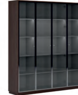
КОМПОНОВКА 2 / ЧЕРНЫЙ МАТОВЫЙ Ш: 184 / Г: 42 / В: 212 СТЕЛЛАЖ ОДНОСЕКЦИОННЫЙ (EMR 431) - 2 ШТ. СТЕЛЛАЖ ДВУХСЕКЦИОННЫЙ (EMR 432) - 1 ШТ. ДЕКОРАТИВНЫЕ БОКОВИНЫ (SJT 470) - 1 ШТ. ДЕКОРАТИВНЫЙ ТОП И ЦОКОЛЬ (SJT 472) - 1 ШТ. ДВЕРКИ БОЛЬШИЕ СТЕКЛЯННЫЙ В АЛ-РАМЕ (SJT 503) - 4 ШТ.