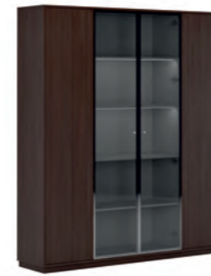
КОМПОНОВКА 1 / ЧЕРНЫЙ МАТОВЫЙ Ш: 184 / Г: 42 / В: 212 СТЕЛЛАЖ ОДНОСЕКЦИОННЫЙ (EMR 431) - 2 ШТ. СТЕЛЛАЖ ДВУХСЕКЦИОННЫЙ (EMR 432) - 1 ШТ. ДЕКОРАТИВНЫЕ БОКОВИНЫ (SJT 470) - 1 ШТ. ДЕКОРАТИВНЫЙ ТОП И ЦОКОЛЬ (SJT 472) - 1 ШТ. ДВЕРКИ БОЛЬШИЕ СТЕКЛЯННЫЙ В АЛ-РАМЕ (SJT 503) - 2 ШТ. ДВЕРКИ БОЛЬШИЕ ГЛУХИЕ (SJT 504) - 2 ШТ.