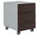
ТУМБА МОБИЛЬНАЯ (SJT 301) Ш: 44 / Г: 55,7 / В: 58