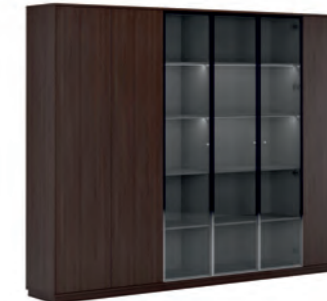
КОМПОНОВКА 4 / ЧЕРНЫЙ МАТОВЫЙ Ш: 274 / Г: 42 / В: 212 СТЕЛЛАЖ ОДНОСЕКЦИОННЫЙ (EMR 431) - 2 ШТ. СТЕЛЛАЖ ДВУХСЕКЦИОННЫЙ (EMR 432) - 2 ШТ. ДЕКОРАТИВНЫЕ БОКОВИНЫ (SJT 470) - 1 ШТ. ДЕКОРАТИВНЫЙ ТОП И ЦОКОЛЬ (SJT 473) - 1 ШТ. ДВЕРКИ БОЛЬШИЕ СТЕКЛЯННЫЙ В АЛ-РАМЕ (SJT 503) - 3 ШТ. ДВЕРКИ БОЛЬШИЕ ГЛУХИЕ (SJT 504) - 3 ШТ.