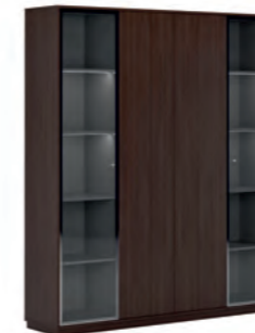
КОМПОНОВКА 3 / ЧЕРНЫЙ МАТОВЫЙ Ш: 184 / Г: 42 / В: 212 СТЕЛЛАЖ ОДНОСЕКЦИОННЫЙ (EMR 431) - 2 ШТ. СТЕЛЛАЖ ДВУХСЕКЦИОННЫЙ (EMR 432) - 1 ШТ. ДЕКОРАТИВНЫЕ БОКОВИНЫ (SJT 470) - 1 ШТ. ДЕКОРАТИВНЫЙ ТОП И ЦОКОЛЬ (SJT 472) - 1 ШТ. ДВЕРКИ БОЛЬШИЕ СТЕКЛЯННЫЙ В АЛ-РАМЕ (SJT 503) - 2 ШТ. ДВЕРКИ БОЛЬШИЕ ГЛУХИЕ (SJT 504) - 2 ШТ.